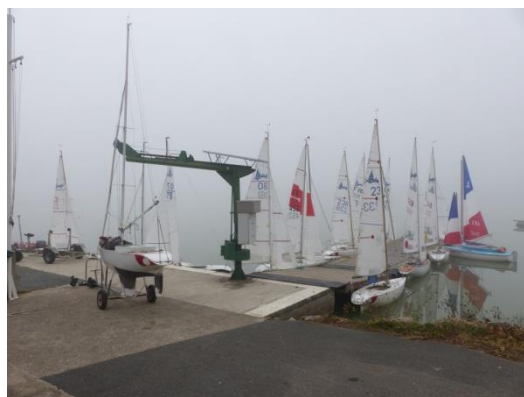
Brume matinale sur le plan d'eau

Cette année ce sont 22 coureurs, dont 3 féminines, venus de PACA, de la Nouvelle Aquitaine et d'Occitanie qui ont disputé 2 jours de régata.