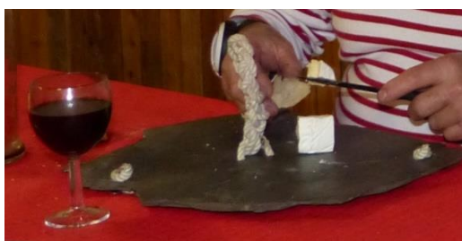
Ce qu'il reste du plateau de fromage ! présenté sur une ardoise sortie de l'ardoisière de Génos (65240)

Tout le monde a passé un moment très convivial en écoutant en Occitan les origines du produit que l'on venait de consommer sans modération.