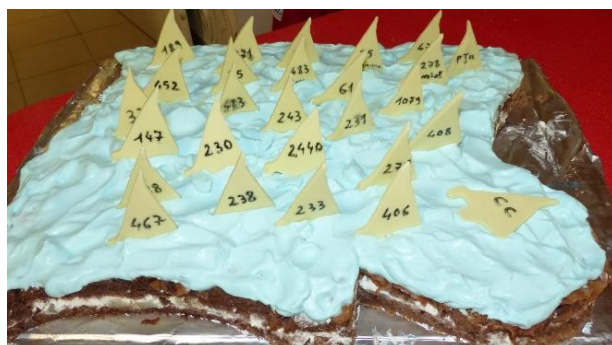
Excellent gâteau représentant le plan d'eau du VHV et les bateaux en chocolat blanc à déguster

Comme de coutume, après que tous aient refait le monde et la régates du jour, Gérard a fait la présentation de tous les coureurs et de leur région. Ensuite, chacun rentrait chez soi pour être frais et dispo, dimanche matin pour prendre le premier départ à partir de 10 heures.